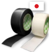
เทปซ่อมพื่อ จากญี่ปุ่น