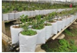
ถุงเพาะชำสีขาว