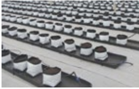
ถุงเพาะชำสีขาว-ดำ