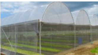
มุ้งกันแมลง