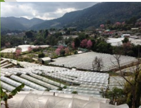
โครงการหลวง จ. เชียงใหม่